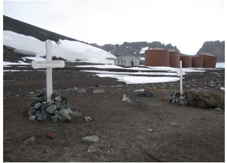
Detalles del cementerio en el frente y restos del pabellón de caza y los tanques de combustible más atrás.