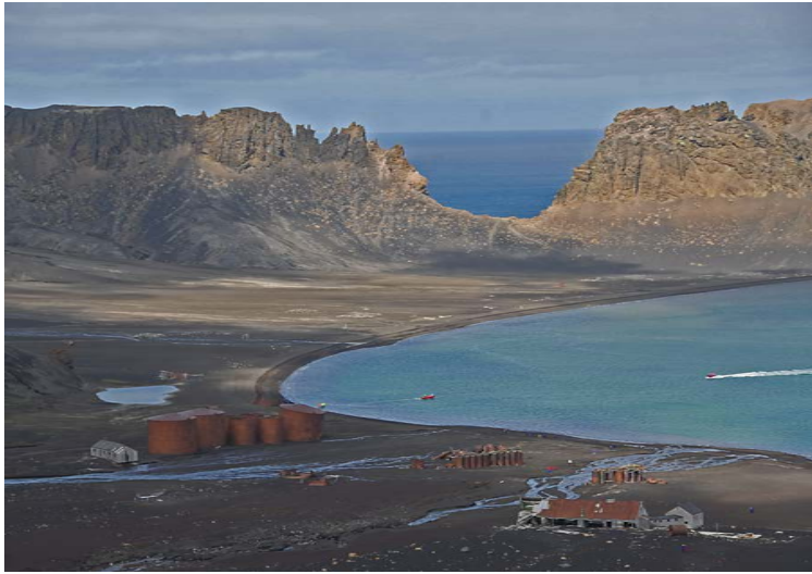
Vista general del sitio para visitantes de la caleta Balleneros con la Ventana de Neptuno en el fondo.